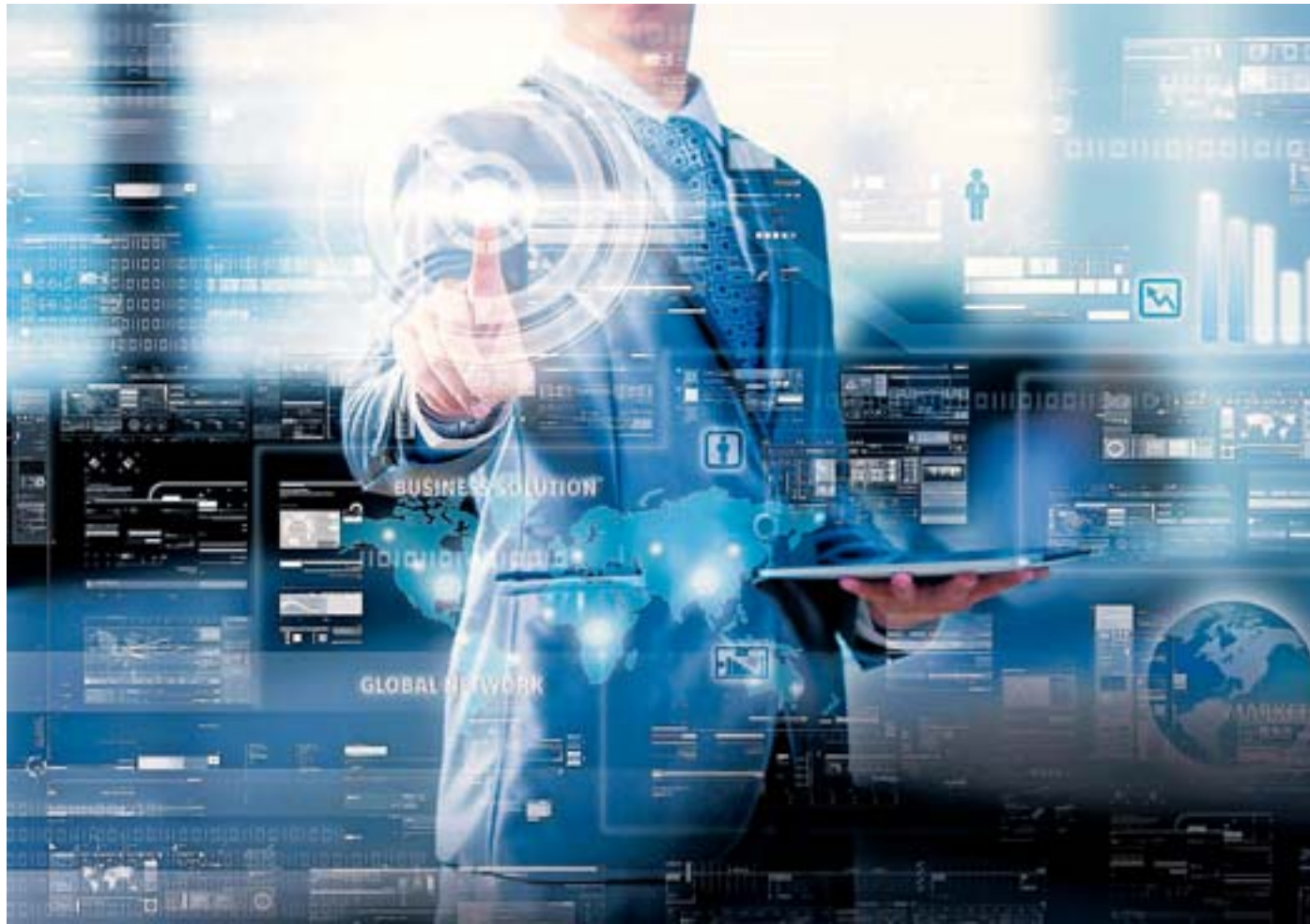
Family Officer müssen auch Risikomanager sein. Ihre Aufgabe ist es, Marktrisiken und politische Unwägbarkeiten ins Visier zu nehmen und insbesondere darauf zu achten, dass die Handlungsfähigkeit über das Vermögen gewährleistet bleibt.

Die Leitlinien definieren in Form von Anlagerichtlinien