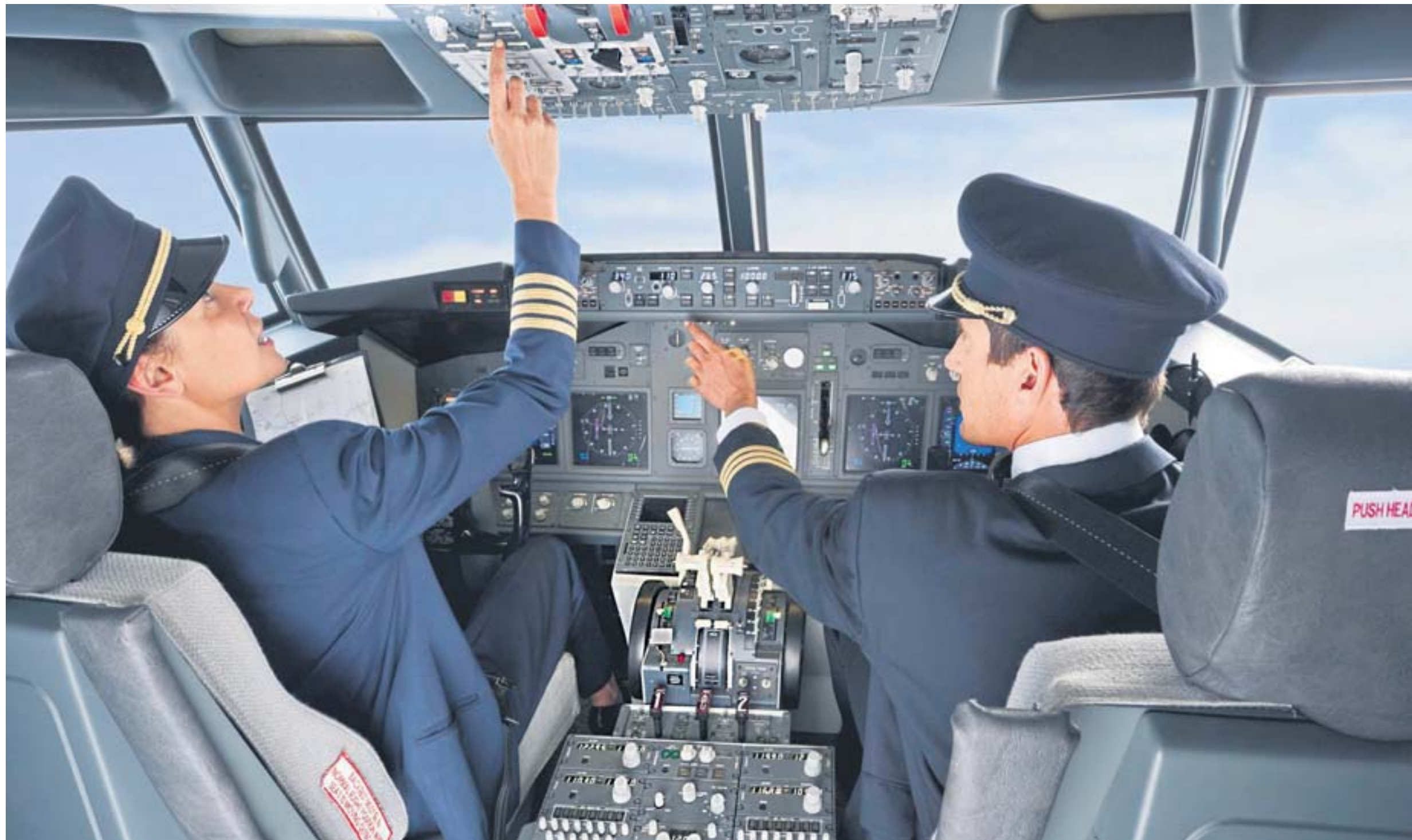
Piloten von Verkehrsflugzeugen müssen hochtechnisierte, komplizierte Abläufe steuern. Damit durchaus vergleichbar sind die Aufgaben, die Family Offices zu bewältigen haben. Sie betreuen vermögende Familien, wählen für sie die Vermögensverwalter und andere Experten aus und kontrollieren deren Arbeit.