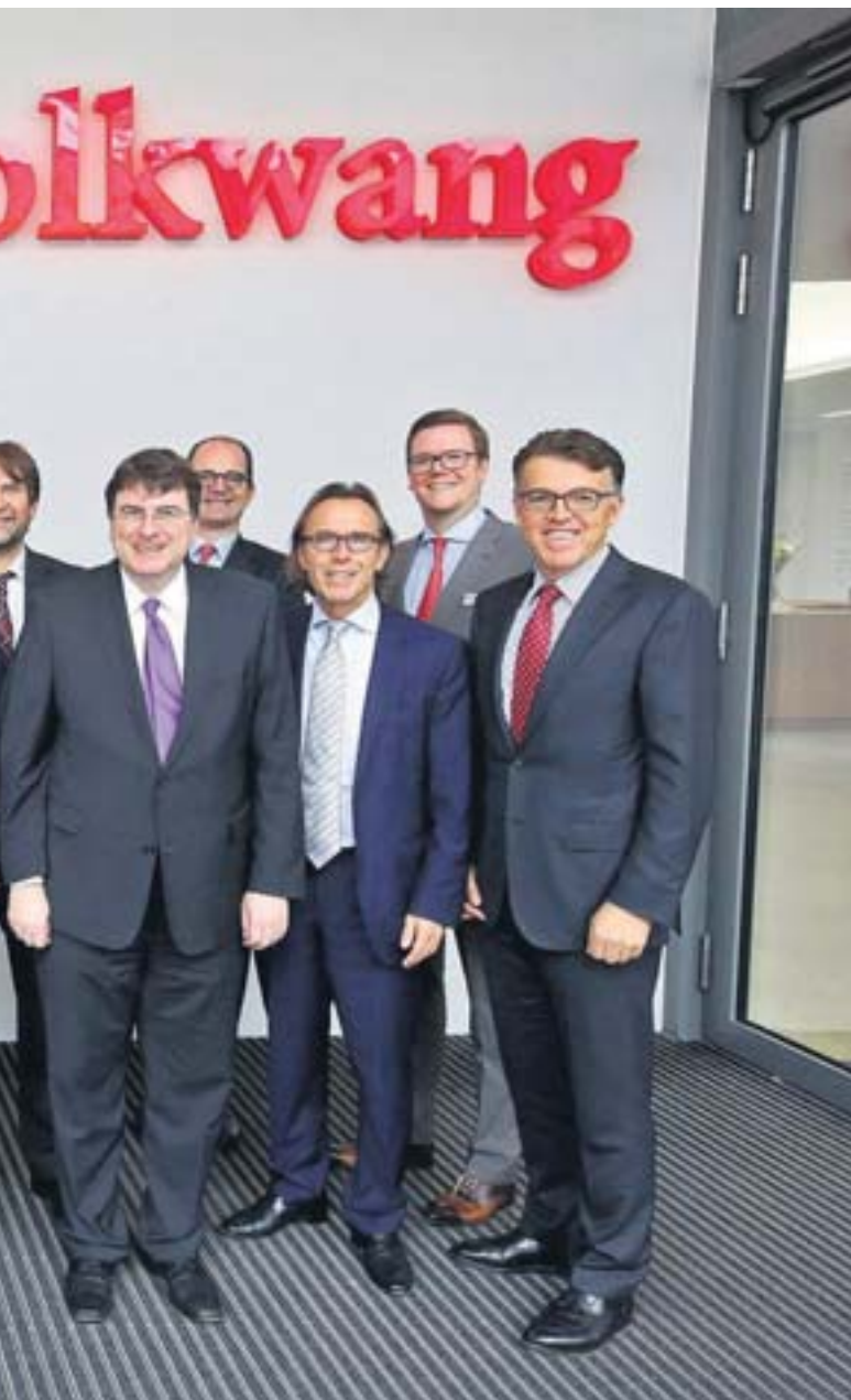
vermögender Familien an ihre Berater und über andere Fragestellungen, die für

Angst, ihr Vermögen zu verlieren. Family Offices begleiten die Familien durch die Zeiten.