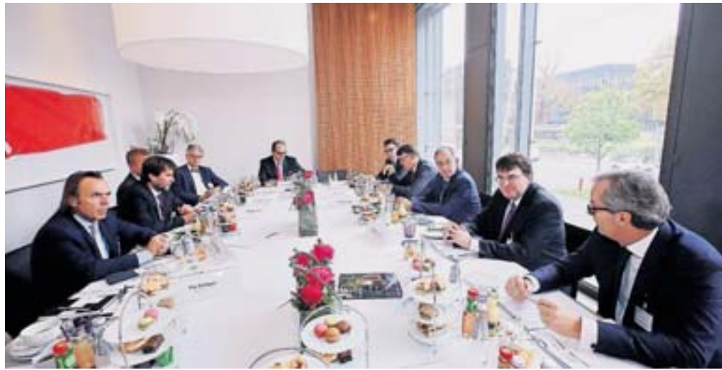
„Eine Family Office-Struktur entsteht immer aus der spezifischen Beratungssituation“ – das ist eine Aussage des zweiten RP-Finanzforums „Family Offices“.